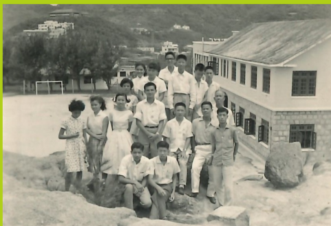
那些年 助道會旅行

服事社群 揚主愛... 承擔使命 65 深水埗浸信會堂慶 1955 - 2020